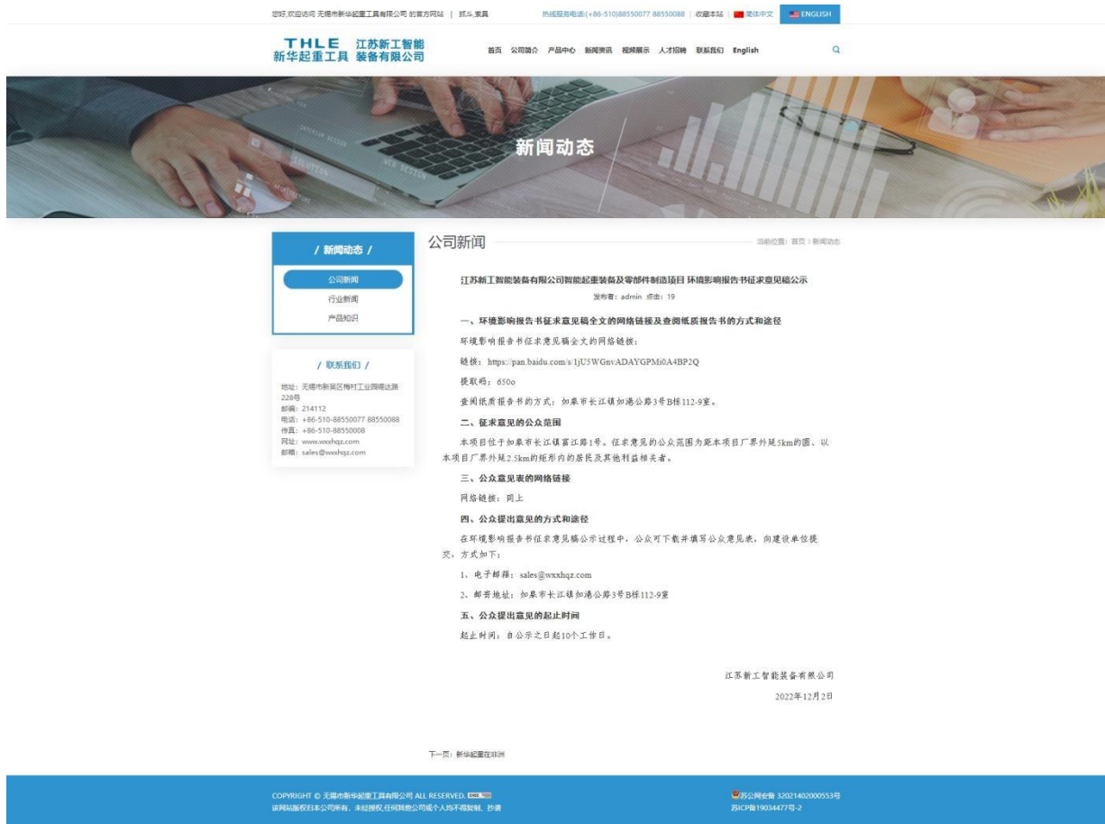
图3.2-1 征求意见稿网络公开截图